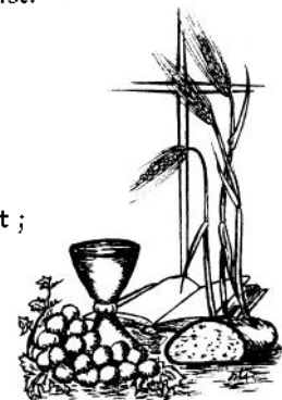
"Faites ceci en mémoire de moi" (Luc 22, 19)

5. Parole ouverte au Dieu qui se dit depuis Noël jusqu'à la croix ; Parole offerte au vent de l'Esprit pour engendrer celui qui croit.